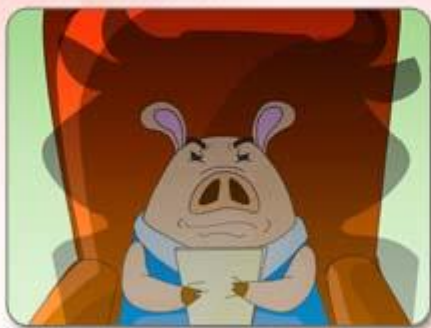
● 護衛自己的身體控制權