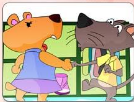
● 要求對方停止該舉動