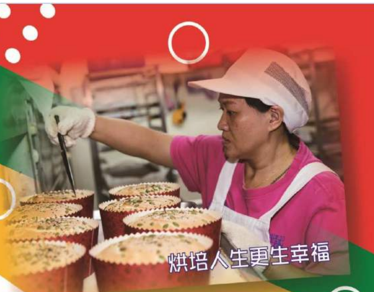
烘焙人生更生幸福