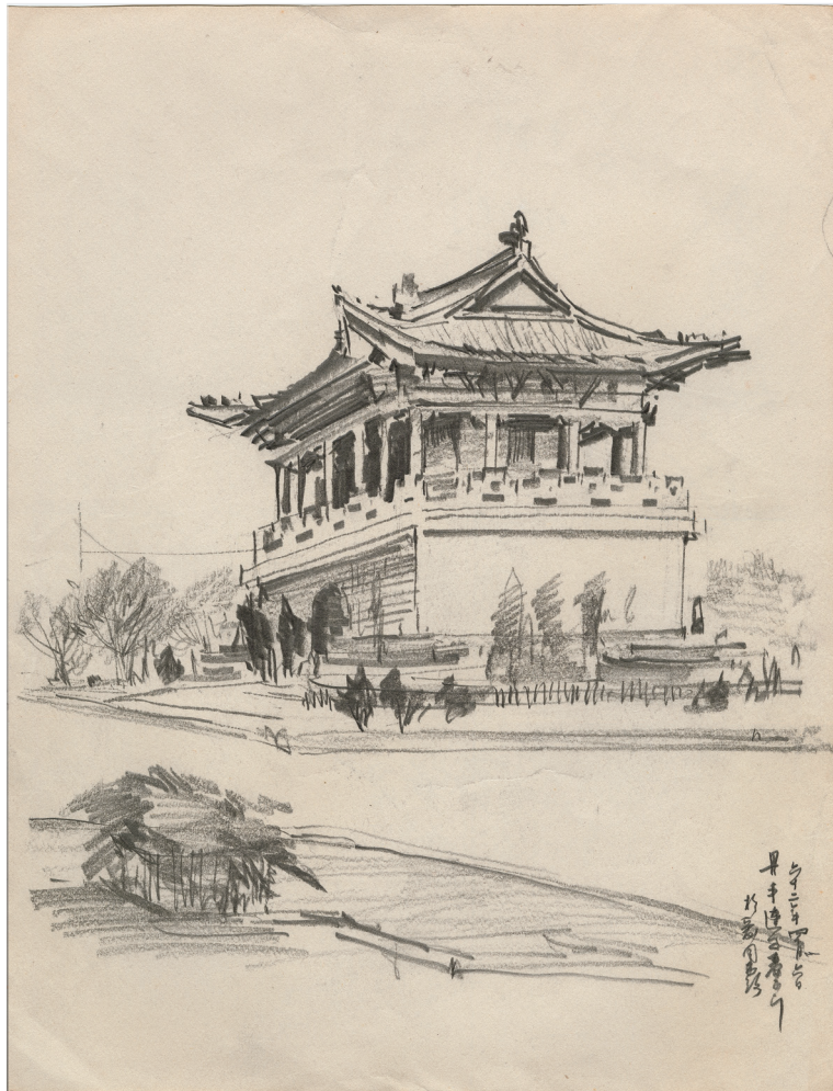
愛國西路小南門 / 梁丹丰 / 國家圖書館