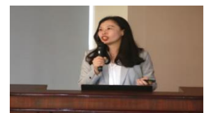
臺灣高等檢察署檢察官分享辦案心得