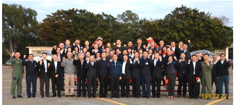
參訪臺中清泉崗空軍基地