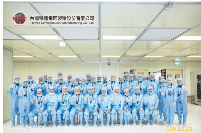
參觀晶圓製造無塵室

本署於109年12月21至23日邀集全國一、二審檢察署檢察長，假臺中地區舉辦109年度第2次檢察長業務座談會。本次會議特別安排參訪漢翔航空工業、台灣積體電路製造股份有限公司及臺中清泉崗空軍基地，使與會人員瞭解國機國造之航太暨國防工業、民間科技產業之發展現況及營業秘密保護機制對產業競爭力領先之重要性，透過此次交流，促成產業界與司法界間之溝通聯繫，提升檢察官專業與辦案效能。