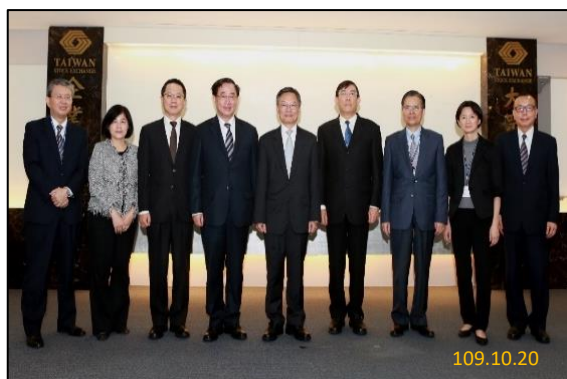
(攝於臺灣證券交易所)

連、股票交易制度變革及監視制度等內容，亦實地參訪集中保管結算所股票博物館及證券交易所股票監視室，行程豐富，期能提升與會主任檢察官偵辦是類案件之專業知能，強化金融犯罪之查緝能量。