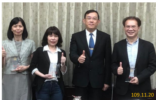
刑檢察長頒獎表揚前 3 名地方檢察署

本專案稽核經濟效益（保障人民財產及增加國庫收益）達新臺幣 1 億 2,973 萬 9,635 元，且各地方檢察署逾十年以上未處理刑事保證金已大幅減少。效益顯現主因在於機關首長認同及同仁投入，本署刑檢察長亦公開頒獎表揚總體效益前 3 名之臺灣臺北、新竹及屏東地方檢察署。