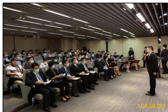
(攝於臺灣集中保管結算所)