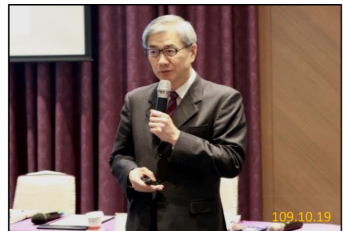
金融監督管理委員會黃天牧主委 講授金融監理新趨勢