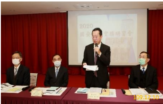
顧立雄秘書長致詞

為強化各檢察署就國安案件之辦案技巧，提升國安案件定罪率及司法公信力，並加強檢察機關與各國安機關間之業務聯繫，本署於 109 年 12 月 10、11 日假本署第三辦公室 341 會議廳舉辦「2020 國安案件實務研習會」，邀集全國一、二審檢察署偵辦國安案件之(主任)檢察官及大陸委員會、國家安全局、法務部調查局、國防部政治作戰局、國防部軍事安全總隊、國防部憲兵指揮部、內政部警政署、海洋委員會海巡署、法務部廉政署等機關辦理國安業務人員參訓。