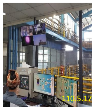
成功大學環境資源研究管理中心銷燬作業