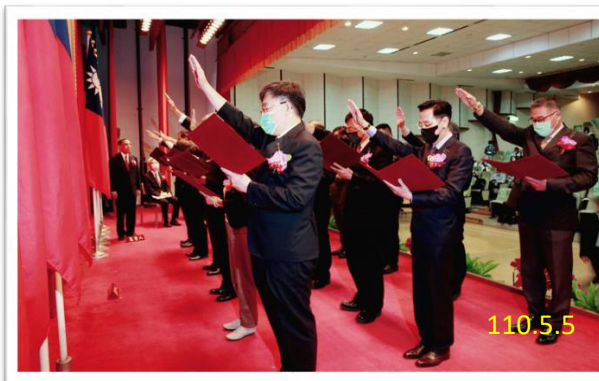
新任檢察機關首長宣示

察首長共同開創及實踐「新檢察文化」，以贏得人民的信賴！典禮尾聲，蔡部長更以普及新文化，帶來新願景，贏得人民的信賴，作為結語，典禮最後也在新任首長、高階主管與觀禮貴賓合影下圓滿落幕。