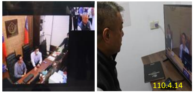
本署書記官長與桃園、新竹地檢署遠距連線測試 訊設備會互相干擾等問題，矯正機關部分，請法務部協調矯正署重新檢視及改善。

經本次實地勘查及實際測試遠距視訊，檢察署偵查庭與矯正機關視訊室之攝影鏡頭拍攝位置，均不甚理想。檢察署部分，由本署通令各檢察署重新檢視及調整鏡頭，另針對矯正機關視訊設備老舊、隔音設備不足、同時使用多組視