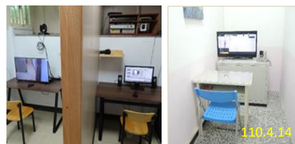
桃園監獄、臺北監獄遠距訊問設備