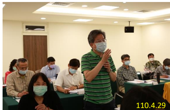
臺北地檢署執行科科長提出意見