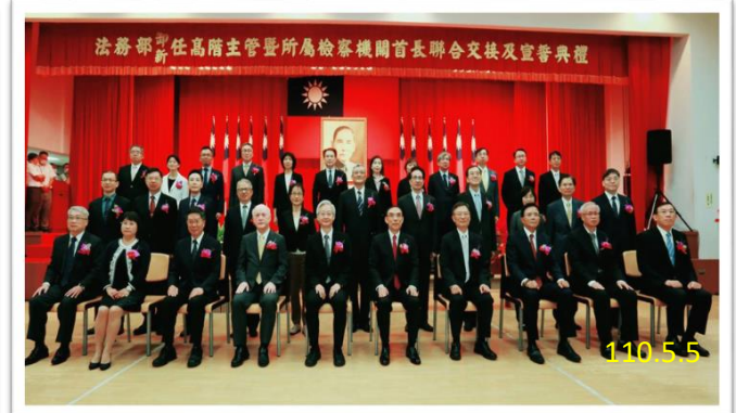
交接典禮全體大合照