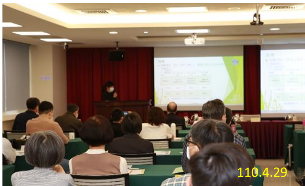
法務部矯正署黃專員報告

作之實務運作」為題報告；另於會議前由與會各地檢署提出意見，彙整提案共 27 則，其中一般提案 19 則，法律問題提案 7 則及臨時提案 1 則，由與會各代表提出相關意見交流及討論；最後由本署王檢察官金聰針對法務部與刑罰執行業務相關函示，進行專題報告。