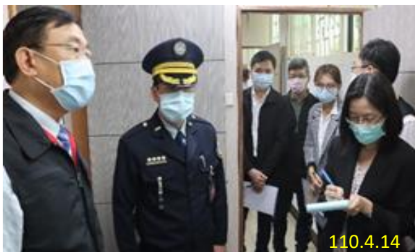
本署刑檢察長（左 1）\ 桃園監獄典獄長（左 2）

有鑑於法院及各檢察署共同使用監所同一視訊設備，為釐清院、檢是否有效分配使用視訊設備，經請矯正署提供 109 年法院及檢察署使用臺北監獄、桃園監獄、綠島監獄及臺北看守所遠距視訊設備件數資料研析，目前檢察署使用遠距視訊之比例明顯高於院方，