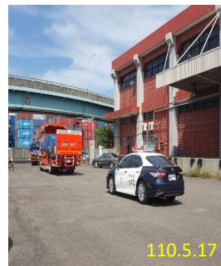
南區大型贓證物庫警方戒護押運銷燬情形