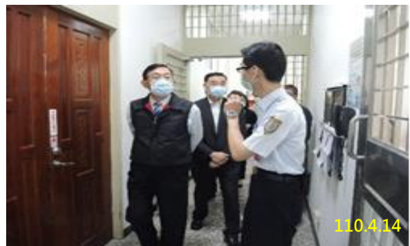
本署刑檢察長勘查情形

勘查當日由本署指定之臺北地檢署、士林地檢署、桃園地檢署、新竹地檢署、彰化地檢署五個地方檢察署分別於遠距訊問偵查庭實機連線至前述三個監所，實際測試遠距訊問偵查庭至監所受訊問端之畫質、聲音、影像是否清晰，有無回音、雜訊等情形、網路頻寬是否充足等，進行實地瞭解使用與運作現況。