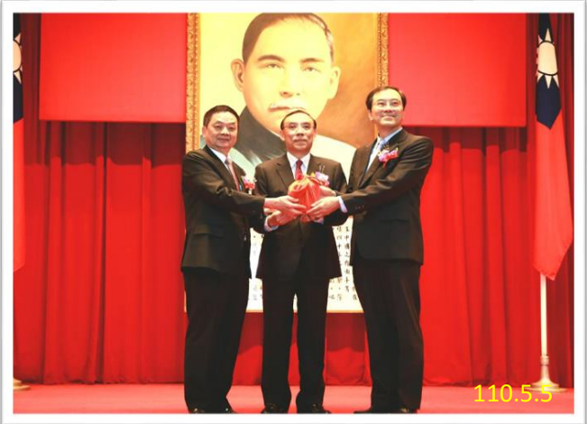
蔡部長主持檢察機關首長交接

本署奉法務部指示協辦「法務部卸、新任高階主管暨所屬檢察機關首長聯合交接及宣誓典禮」，典禮於 110 年 5 月 5 日上午 10 時假司法新廈 5 樓大禮堂舉行，由蔡部長主持監交，並邀請司法院林秘書長輝煌、鈞部蔡政務次長碧仲、張常務次長斗輝、最高檢察署江檢察總長惠民、本署邢檢察長泰釗、最高行政法院吳院長明鴻、臺灣高等法院李院長彥文、臺灣臺北地方法院黃院長國忠、中華民國律師公會全國聯合會許副理事長雅芬及全國一、二審檢察首長等貴賓蒞臨觀禮。在首長交接及宣誓後，由司法院林秘書長輝煌、中華民國律師公會全國聯合會許副理事長雅芬，分別以貴賓身分上臺致詞表達恭賀之意。典禮中蔡部長致詞時則以期許、實踐及展望，勉勵在座新任及現任高階主管及檢