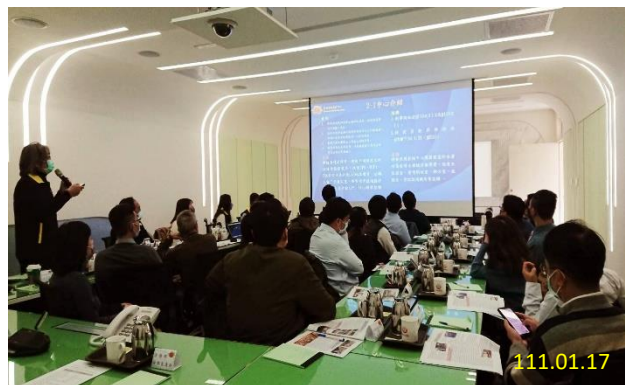
科技監控教育訓練-檢察官種子班

未來，期待藉由科技設備監控中心之建置，可以推展相關技術至犯罪偵查、被害人保護及刑事執行等各項領域，以節省司法資源，達到科技偵查與精準執法，兼顧社會公義與人權保障。