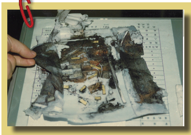
75 年到 80 年間桃園地區賭博性 電玩猖獗，左圖為歹徒以炸彈賀 卡恐嚇司法人員之實物相片