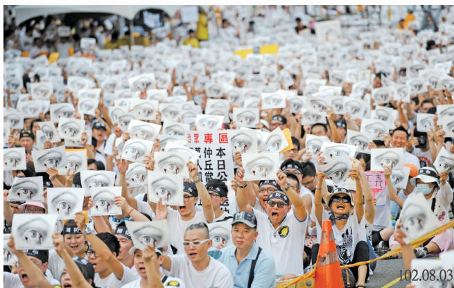
白衫軍運動聚集 25 萬上凱道

本案偵辦期間，立法委員陳亭妃召開記者會指出陸軍 269 旅政戰主任陳○銘疑似下令將洪○丘禁閉室關鍵監視錄影檔案銷燬，觸犯刑法湮滅刑事證據罪，依當時法制該罪應由普通司法機關進行偵審，因此國防部高等軍事法院檢察署於 102 年 7 月 20 日下午，將陳○銘涉嫌湮滅刑事證據一案函送臺灣桃園地方法院檢察署偵辦。