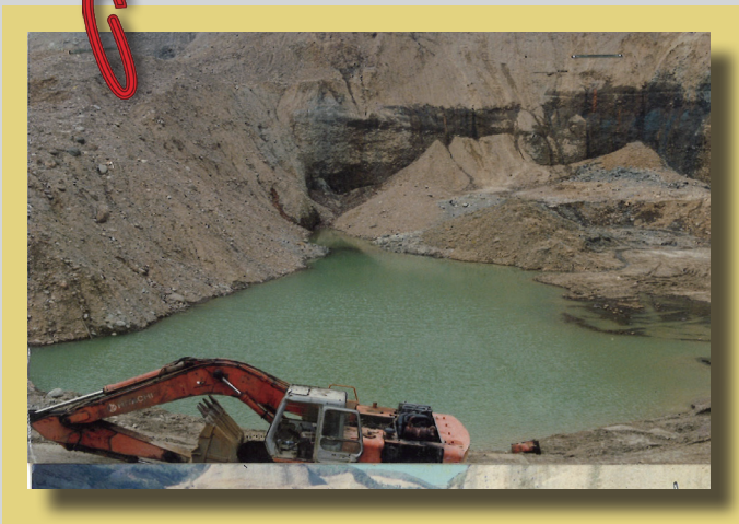
上、右圖為 76 年到 80 年間， 桃園龜山山區盜採砂石猖獗 盜採現場相片