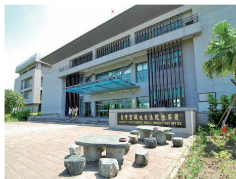
宜蘭地檢新大樓外觀

因業務日繁，員工倍增，原辦公廳舍老舊，環境擁擠，90年間向宜蘭縣政府購得土地，93年6月3日動工興建，96年11月底完工，同年12月13日落成啟用。