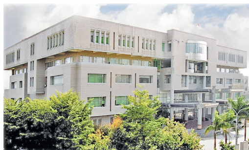
苗栗地檢署現址辦公大樓 / 苗栗地檢署

由「臺灣新竹地方法院」及「臺灣新竹地方法院檢察署」共同組成興建委員會籌劃，選任建築師規劃設計及監造發包，於 82 年 10 月 28 日動工，85 年 12 月 6 日完工。新建之辦公大樓即位於苗栗縣苗栗市中正路 1149 號之現址。