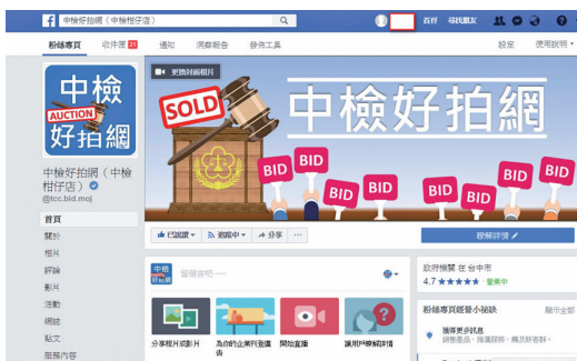
中檢好拍網臉書粉絲專頁 / 臺中地檢署

(二) 於 103 年 12 月 27 日成立臉書粉絲專頁「中檢好拍網」，將拍賣訊息散播給加入之好友，吸引一般民眾前往競標，達到宣傳效果。