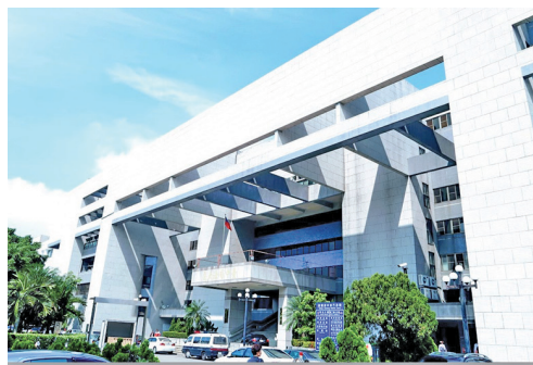
臺中司法大廈 / 臺中地檢署

97年11月間將原檔案室及職務宿舍使用之大樓，改供觀護人室、檔案室、觀護助理員、司法保護中心及同仁宿舍使用，並更名為臺灣臺中地方檢察署第三辦公大樓。