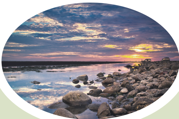
彰化福寶濕地 /2018.6.25