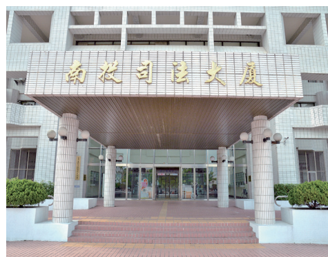
南投司法大廈 / 南投地檢署