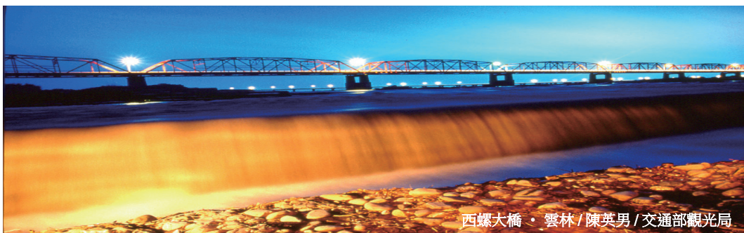
西螺大橋・雲林

雲林地檢署之「查緝黑金行動專組」（即俗稱之「特偵組」）乃係96年6月1日，由時任檢察長陳報法務部核准成立之全國第一個非指定地檢署之特偵組，初期任務專責上開第7屆立法委員查賄事宜，先後查獲現金賄選2、30起，更破獲「史上最大賄選案」案，總扣案賄選金額達數百萬，查賄績效領先全國，並載於法務部通訊，係創署以來前所未見之盛事。