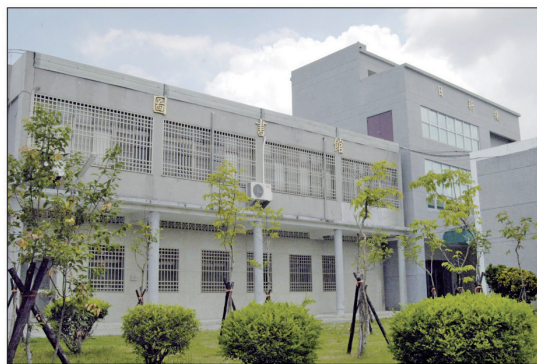
雲林地檢署圖書館 / 雲林地檢署

於96年12月3日開始整修，將原多媒體教室改建為圖書館、新知關懷研習中心及署史館，97年1月7日完工，作為員工及更生、觀護、犯保等3會關懷保護對象之讀書空間，署史館則保存地檢署歷年來的寶貴文物資料，流傳後世。