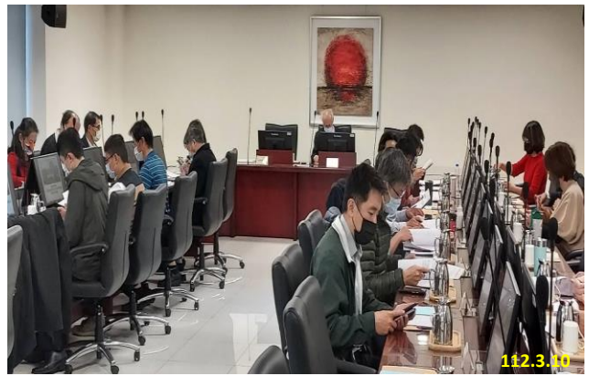
防制申辦大量電信門號及電信網路詐欺策進作為研商會議

本署除持續統合所有檢察及司法警察機關，落實行政院「新世代打擊電信網路詐欺策略行動綱領」懲詐之各項作為外，並積極研究各類型電信