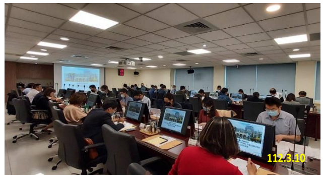
防制申辦大量電信門號及電信網路詐欺策進作為研商會議

網路詐欺犯罪所運用之科技、金融及電信工具，彙集查緝層面所發現之各面向議題，並與主責「識詐」、「堵詐」、「阻詐」之行政主管機關隨時交流，以結合政府各機關力量全面打擊電信網路詐欺犯罪，確保民眾財產安全。