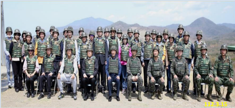
恆春三軍聯訓基地/大合照