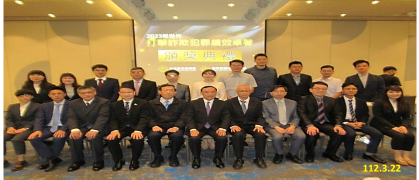
112 年度北區新世代打擊詐欺策略行動研習會/大合照