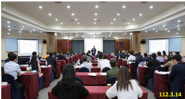
「112 年度第 1 次檢察長業務座談會」

訂於明(113)年 1 月 13 日舉行，特別安排「因應 113 年總統副總統選舉查察策進作為」專題報告；座談會由各地方檢察署檢察長就當前署內或轄區內亟需解決之打詐、反詐騙、查緝人蛇集團、掃毒、掃黑等問題進行報告，並提出對策及精進作為、分享經驗及及施行成效。期能藉此充分達到意見交流、經驗傳承，貫徹法務部施政重點。