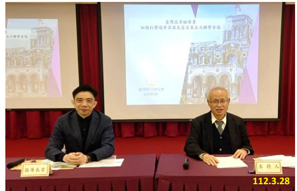
加強打擊境外茶混充臺茶第五次聯繫會議

會議中由本署報告是類案件收結情形、112 年春節執行查察境外茶混充臺茶行動方案推動情形；並針對 112 年春茶產季：①本署防堵境外茶混充臺茶規劃方案、②行政院食品安全辦公室行政稽查規劃等事項進行討論。期有效提升是類案件之偵查效能，強力遏阻境外茶混充臺茶之不法案件。