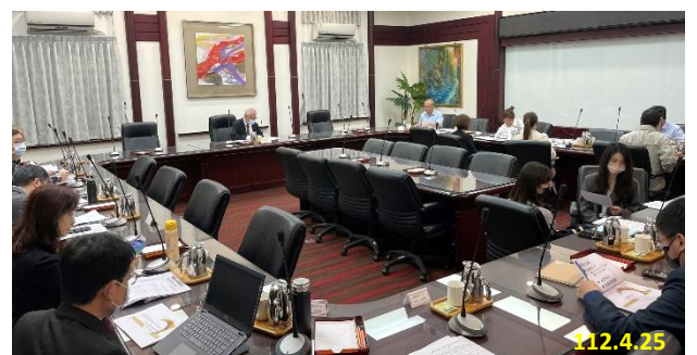
「偽基地台」詐欺查緝策略研商會議

議（如何偵測異常、如何鎖定行為...等）、是否有必要建立即時通報機制等議題提出討論。期透過會議交流及討論，強化是類案件之查緝及偵辦效能。