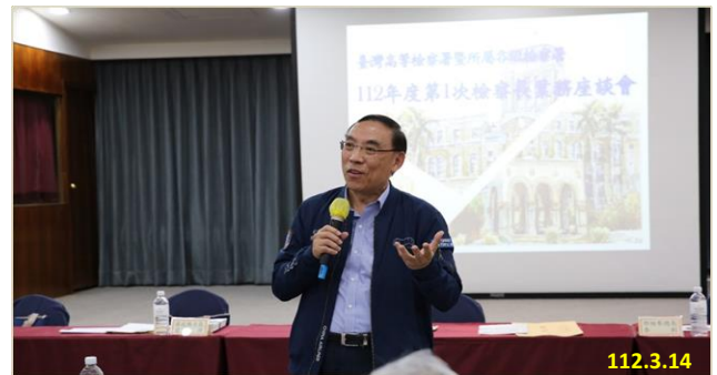
「112 年度第 1 次檢察長業務座談會」 法務部蔡清祥部長致詞