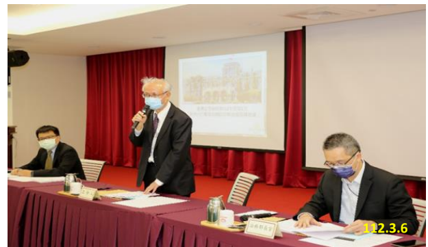
112 年度第 1 次「新世代打擊電信網路詐欺查緝督導」會議

①「第三分支業詐欺之偵辦與研析」、②「電信網路詐欺求職遭囚案(含策進作為)以台版柬埔寨案為中心」、③「電子支付帳戶遭詐欺集團不法利用分析與建議」、④「投資(虛擬貨幣)詐欺」、⑤「電商業交議資料外洩及資安維護」等專題進行報告。期能透過專題分享，並協調各機關研議偵查打擊策略，整合打詐量能，落實本署「新世代打擊電信網路詐欺查緝督導計畫」。