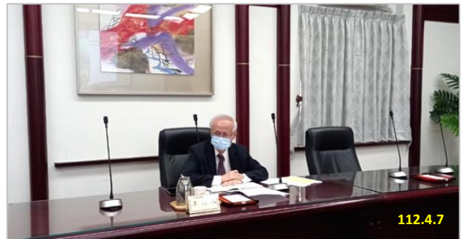
本署張檢察長主持會議