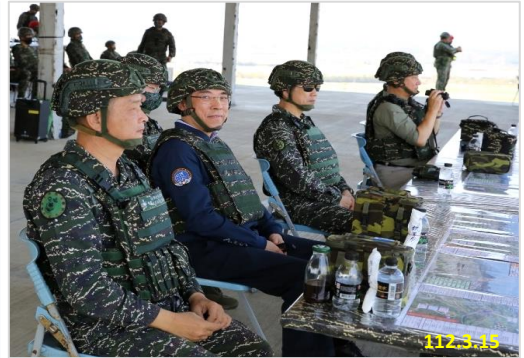
參訪：恆春三軍聯訓基地演訓