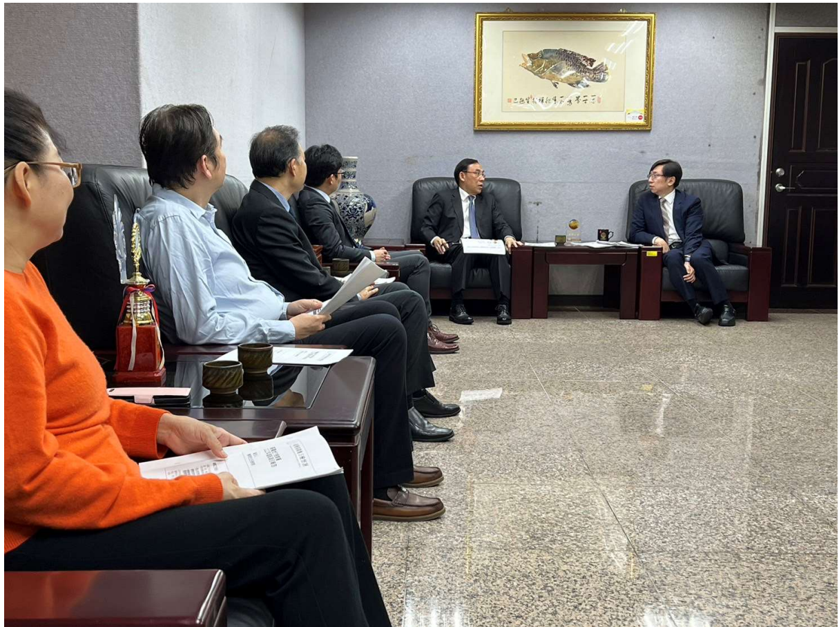
（蔡部長訪視基隆地方檢察署。圖為蔡部長（中左一）、本署李檢察長（中右一）與檢察官進行座談）