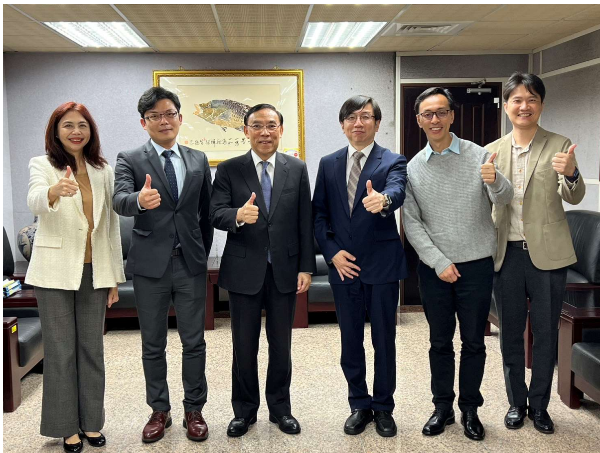
（蔡部長訪視基隆地方檢察署。圖為蔡部長（左三）本署李檢察長（右三）與主任檢察官之合影）