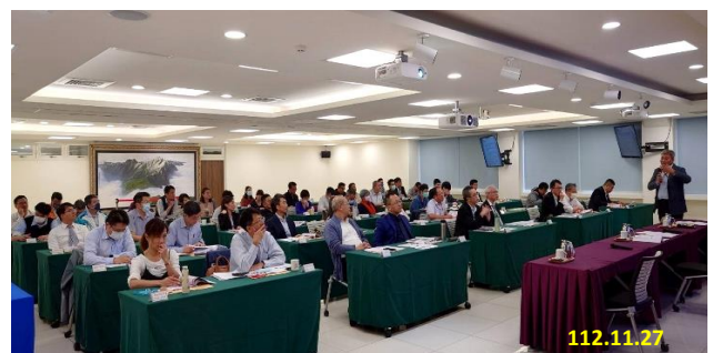
112 年度第 2 次新世代打擊電信網路詐欺查緝督導會議