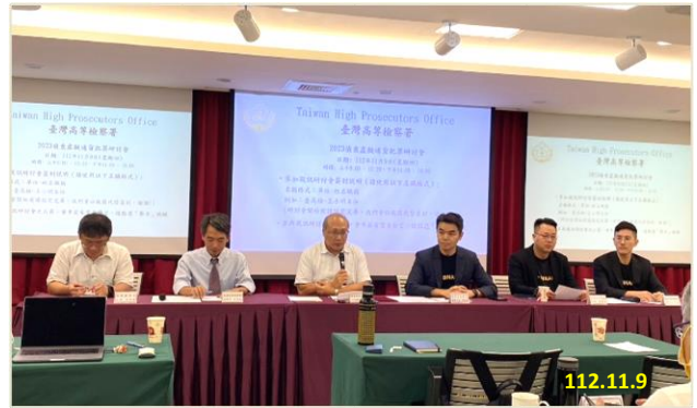
2023 偵查虛擬通貨犯罪研討會

挑戰」、「虛擬通貨案件之發展」，並舉行綜合座談會，強化講座與學員間交流互動，藉此研討會增進是類案件偵辦知能，以落實瓦解詐欺犯罪集團目標。