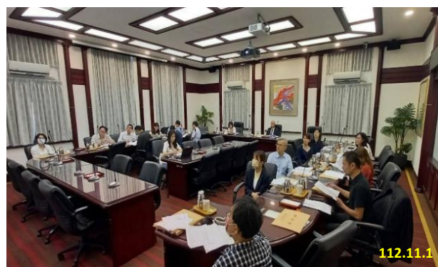
犯罪被害人通報機制討論會議

案件數量？②建請警政署持續規劃相關課程或進行布達，以提升基層員警對於「警察機關關懷協助犯罪被害人實施計畫」有關重傷案件初步判斷之認識與了解。③如何加強各地檢署檢察官第一時間之通報機制等議題進行討論。透過跨機關研商討論，期能落實犯罪被害人通報轉介機制，以即時提供必要協助或採取適當保護措施。