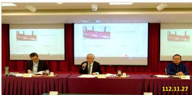
112 年度第 2 次新世代打擊電信網路詐欺查緝督導會議 本署張檢察長致詞

會中由本署專責檢察官就督導計畫執行情形報告，並邀請金融監督管理委員會、國家通訊傳播委員會、數位發展部分別就「金融監督管理委員會近期推動防詐精進措施」、「國家通訊傳播委員會堵詐措施之協力作為」、「數位發展部在詐欺防制與打擊之協力作為」等專題進行報告；並針對①外界質疑電信詐欺案件量刑過輕等是否有因應對策、②電信詐欺案件之量刑、③司法院量刑趨勢建議系統等提案進行討論。期能透過專題分享、提案討論交流，協調各機關研議偵查打擊策略，整合打詐量能，落實本署「新世代打擊電信網路詐欺查緝督導計畫」。