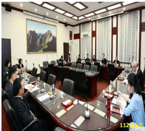
本署與三大職籃聯盟合作機制會議

未來希望藉由上開機制之運作，有效預防、嚇阻不法行為介入國內職籃運動，以打造健康的職籃運動環境。