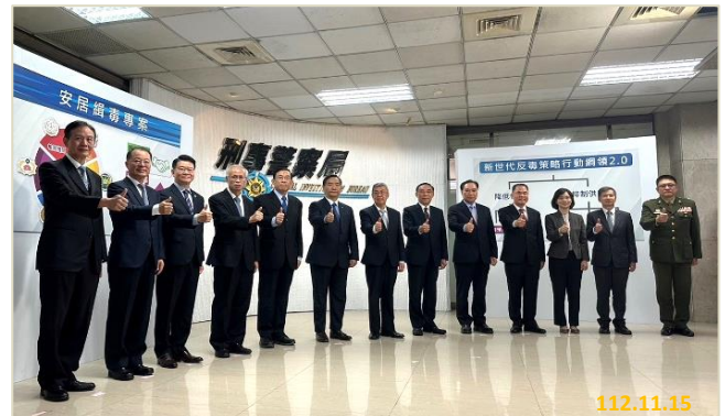
「安居緝毒專案」記者會-大合照