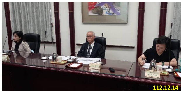
偵辦放射性物質走私調查、聯繫會議