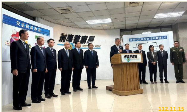
「安居緝毒專案」記者會-行政院陳建仁院長致詞

愷他命自 111 年迄 112 年 8 月之查獲量佔各級毒品查獲量第一位，製造愷他命之先驅原料查獲量也逐年上升，顯見毒品市場對愷他命及其先驅原料需求甚高，而愷他命對年輕族群之危害性甚高，因此第九波安居緝毒專案規劃之查緝重點即在愷他命，從源頭端加強查緝運輸、製造、販賣等不法行為，並向下刨根挖掘施用黑數。此外，也持續查緝新興毒品、各級製毒工廠、幫派涉入毒品、利用網路販毒等。