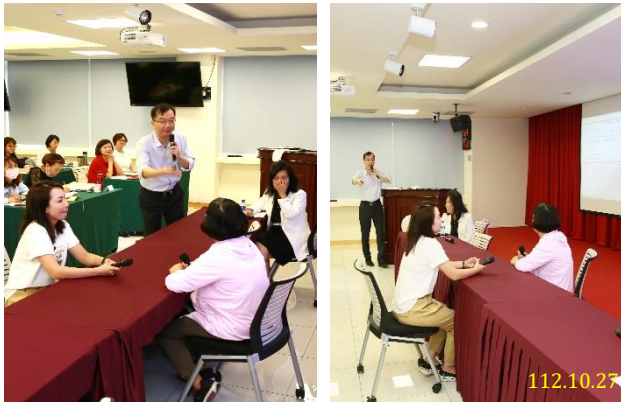
112 年度特約通譯講習-「實務演練」課程

本次講習有手語、蒙古語、阿美語、布農語、越南語、印尼語、菲律賓語、日語、英語、法語、西班牙語、泰語、韓語等通譯人才共計 74 人參訓。