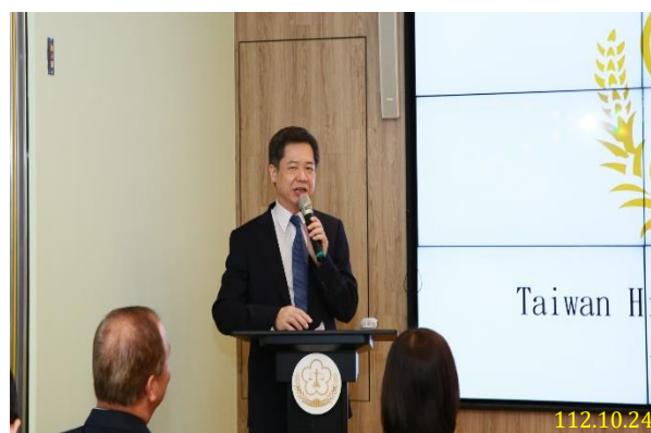
本署王金聰主任檢察官主持記者會

愷他命為第三級毒品，為中樞神經抑製劑。依據報告顯示，愷命命的副作用有心搏過速、血壓上升、呼吸困難、噁心嘔吐、體溫上升、視力模糊、失去平衡、肌肉震顫等，而對心理及行為的影響為記憶力受損、認知錯亂、失眠焦慮、多疑、幻覺幻聽、意識迷糊及產生解離作用，長期使用的危害則為產生藥物耐受性及依賴性、罹患慢性間質性膀胱炎及腎功能不全等，國人尤其是年輕族群千萬不要輕忽愷命命的危害性。