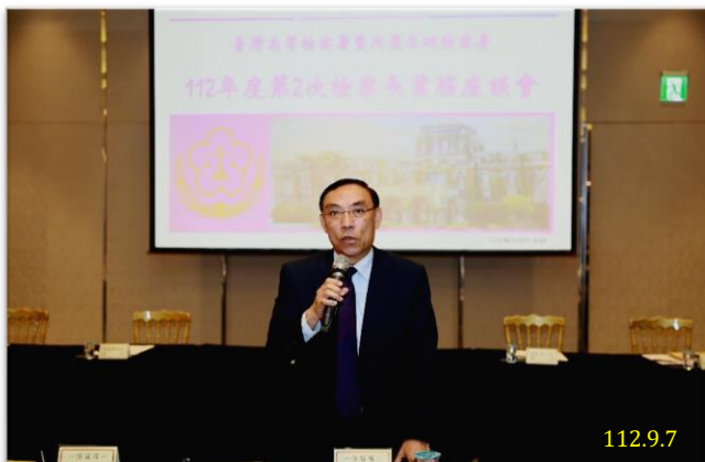
法務部部長蔡清祥致詞

策進作為」專題報告；並由各地方檢察署檢察長就當前署內或轄區內亟需解決之打詐、反詐騙、緝毒、掃黑、人口販運及國安案件等議題進行報告，提出對策及精進作為、分享經驗及成效。期能藉此充分達到意見交流、經驗傳承，貫徹行政院及法務部施政重點。