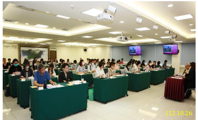
112 年度特約通譯講習

期能透過此次講習，加強特約通譯人員專業及提升傳譯品質，以保障不諳國語人士之訴訟權益。