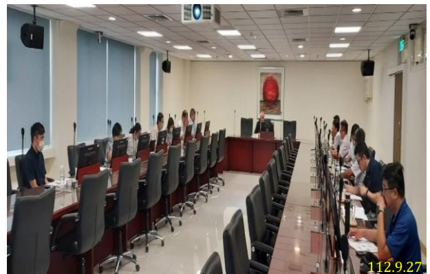
以涉詐電信門號驗證虛設網路帳號處理流程研商會議

(二)112 年 9 月 27 日召開「以涉詐電信門號驗證虛設網路帳號處理流程研商會議」，會議由本署張檢察長主持，邀請國家通訊傳播委員會、