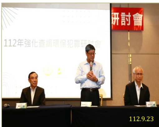
行政院張子敬政務委員致詞

，發揮很大之功效，感謝合作夥伴們長期的付出。法務部蔡清祥部長致詞時，除肯定同仁努力執法之辛勞，更感謝環境部特別設置「金環獎」，對於第一線查緝同仁有無比之鼓舞，並期許日後各機關繼續充分合作，不只查緝犯罪，亦將追討犯罪所得及要求不法業者將犯罪場址回復原狀之情形列為日後求刑與申請假釋之參考，發揮更有效防制與查緝環保犯罪之功能。環境部沈志修次長則強調在檢警環聯繫平臺成立後，已有七百多個犯罪場址回復原狀，於今年 8 月間環境部成立後，原環境督察總隊升格為環境管理署，將會延續環保署時期堅持守護環境、守護國土之精神，持續充實科技設備，強化環保犯罪之執法，並繼續推動跨機關、跨縣市之合作，向民眾展現執法魄力，展現共同打擊環保犯罪之成效。