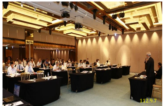
112 年度第 2 次檢察長業務座談會