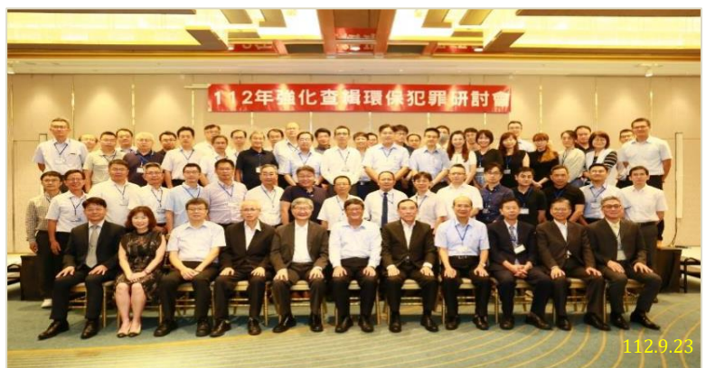
「112 年強化查緝環保犯罪研討會」全體大合照