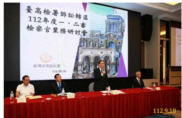
法務部部長蔡清祥致詞

議題；(2)就犯罪被害人權益保障法新法修正施行，增訂被害人保護命令、強化犯罪被害人之安全保障等規定；(3)行政院核定「新世代反毒策略綱領」，有關緝毒及新增訂的「再犯防止推進計畫」等議題；(4)明(113)年 1 月 13 日第 16 任總統及第 11 屆立法委員選舉將至，有關選舉查察精進作為。期使與會一二審(主任)檢察官了解當前檢察機關重要事項。