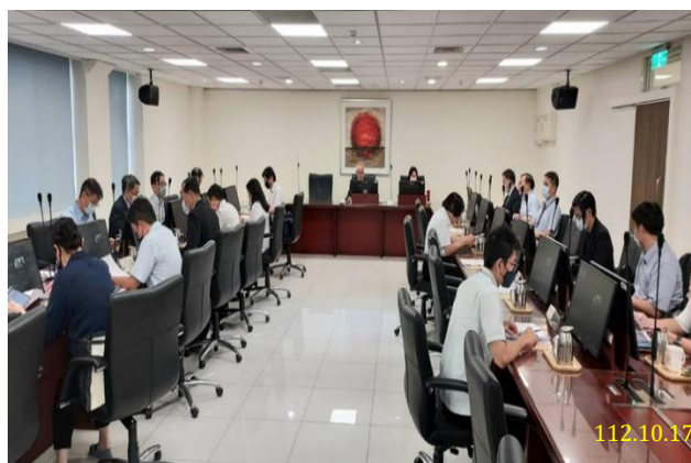
112年度打擊妨害綠能產業發展犯罪協調聯繫會議

在檢察機關與司法警察機關共同合作下，已強力查緝綠能產業蟑螂，成果豐碩—自110年起，截至112年9月30日止，檢察機關因查緝妨害綠能產業發展犯罪，總計偵辦108案，羈押20人，起訴67人(47案)，緩起訴23人(7案)，扣案(含扣案帳戶內金額)新台幣7,971萬2,500元，人民幣1萬7,600元，日幣56萬6,000元，自動繳回新台幣2,110萬8,100萬元，扣押不動產18筆、黃金金條2條，手錶7只，金飾1盒。