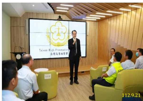
「加強打擊境外茶混充臺茶」聯合記者會

首先，衛福部食藥署於 110 年 11 月 5 日審查通過公告農業部茶及飲料作物改良場(下稱茶改場)之「多重元素檢驗方法」可有效鑑定分辨境外茶與臺茶，該署與農業部農糧署、保安警察第七總隊第三大隊即開始進行數波聯合行政稽查，查獲並陸續移送 36 件疑似不法案件至各地檢察署