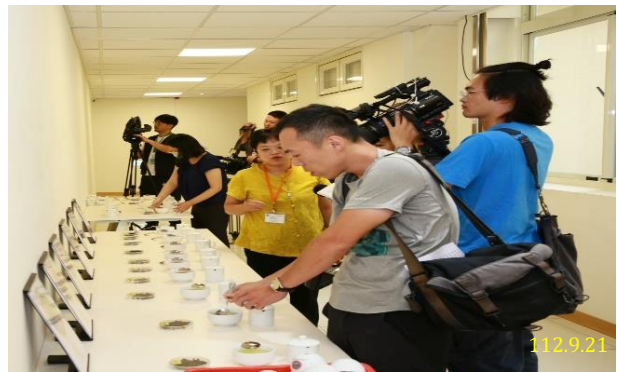
記者會現場—分辨臺茶與境外茶混充臺茶之差異