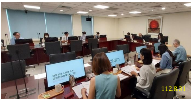
第2次「犯罪被害人保護命令送達程序討論會議」

鑑於犯罪被害人權益保障法(下稱犯保法)修法，增訂「犯罪被害人保護命令」規定，本署於112年8月31日、9月12日分別召開「犯罪