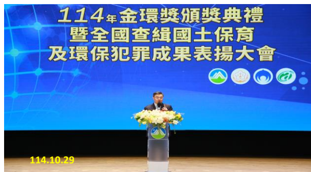
卓榮泰院長蒞會訓勉

為落實國土保育與環境永續發展目標，及遏止不法業者對於國土環境的危害，本署、內政部警政署、環境部環境管理署及農業部林業及自然保育署在環境部會議廳共同舉辦「114 年金環獎頒獎典禮暨全國查緝國土保育及環保犯罪成果表揚大會」，邀請行政院卓榮泰院長蒞臨會場勗勵跨部會的多名查緝英雄，同時亦邀請行政院陳金德政務委員、林明昕政務委員、李慧芝發言人、法務部鄭銘謙部長、環境部彭啟明部長、環境部沈志修常務次長、法務部調查局陳白立局長、環境管理署顏旭明署長、林業及自然保育署廖一光副署長、警政署李文章副署長、本署張斗輝檢察長等貴賓蒞臨會場共襄盛舉。