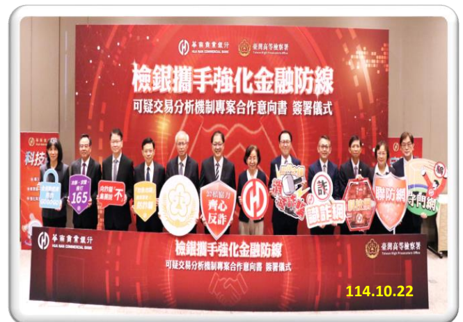
邀請鄭銘謙部長、金管會銀行局王允中副局長及臺北地檢署王俊力檢察長、新北地檢署郭永發檢察長、士林地檢署張云綺檢察長到場觀禮