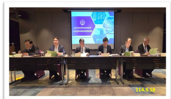
最高檢察署邢檢察總長、法務部黃政務次長、檢察長、徐政務次長、黃常務次長、本署張檢察長 (由左至右)

座談會由本署及法務部檢察司、保護司針對重要檢察業務、檢察行政事項提出業務報告；臺北、臺中、彰化、橋頭、新北地檢署分別就「公司（商號）人頭帳戶之查緝與防制」、「預警制度下的新視野——神說公司吸金案」、「統整全國資料從根打擊詐騙地面師——保護中高齡被害人之辦案經驗分享」、「依托咪脂毒品查緝專案報告」、「細微線索拆解閃兵大平台：藝人妨害兵役案偵辦實錄」為專題報告，並透過分享與討論建議，期藉此充分達到意見交流、經驗傳承，貫徹法務部及行政院施政重點。