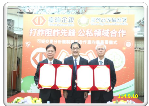
本署與臺灣企銀 【打詐阻詐先鋒 公私領域合作】 可疑交易分析機制簽署儀式

鄭銘謙部長表示： 本次臺高檢署與臺灣企銀簽署「可疑交易分析機制」合作意向書，象徵公私協力更深化，協助第一線金融從業人員精準阻詐，由執法單位擔任後盾，減輕銀行行員壓力；並強調「打詐綱領2.0」的核心目標是讓人民有感，法務部除促請臺高檢署繼續督導檢、警、調加強查緝境、內外詐欺集團、溯源斷根外；在策略上，亦促請各地檢署，對於事證明確之詐團核心份子，包括車手，加強聲請羈押，以鞏固事證，溯源斷根，澈查犯罪網絡；對於未賠償被害人所受損害之詐團，從重求刑、上訴；加強查扣詐團之犯罪不法利得，以填補被害人所受損害，讓民眾真正有感政府守護民眾財產之決心。