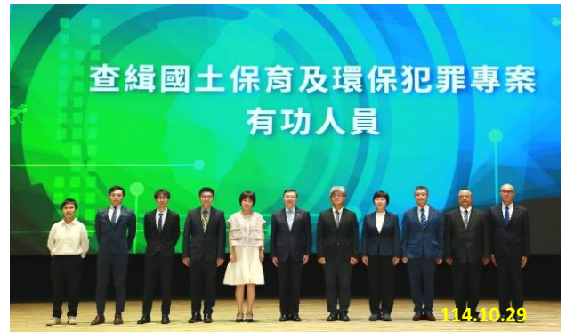
卓院長頒獎予 10 位受獎人並與受獎人合影留念

表揚活動中，卓院長致詞時特別勉勵各位受表揚人，並提到今日提到的各項獲獎案例，行為態樣相當多元，包含違法傾倒廢棄物及土石方，或將化學物質流放河川中而汙染水質等，這些違法行為對於臺灣的國土保育造成極大的挑戰，也因此有今日來自檢、警、調、環、林等跨機關，共同辦理今日的表揚大會，藉此機會讓這些獲獎人員成為各機關以及社會大眾的楷模，也藉此影響各機關的查緝人員，更積極投入保育山林的工作。法務部鄭銘謙部長更提到，面對日益嚴峻的環境污染的挑戰，我們始終都應該以積極偵查作為來回應社會的期待，展現政府在環境保護上的努力與堅持；鄭部長也特別感謝今天受表揚的每一位每一位同仁，讚揚各位查緝先鋒皆是團隊的典範，因為查緝同仁奉獻專業、勇氣與責任心，守護了環境正義，值得社會大眾由衷的敬佩與感謝。