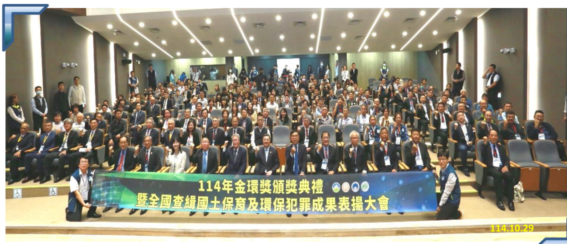
「114 年金環獎頒獎典禮暨全國查緝國土保育及環保犯罪成果表揚大會」現場大合照

本次表揚大會由本署、內政部警政署、環境部環境管理署、農業部林業及自然保育署共同辦理，藉此鼓勵查緝國土及環保犯罪成效卓著、表現優秀的各部會機關人員，也象徵政府持續深化打擊國土及環保犯罪的決心，展現執法人員專業與熱忱守護土地的精神。未來，本署將持續強化查緝能量，凝聚保護環保正義之社會共識，守護青山綠水，讓臺灣成為子孫世代安居樂業的永續家園。