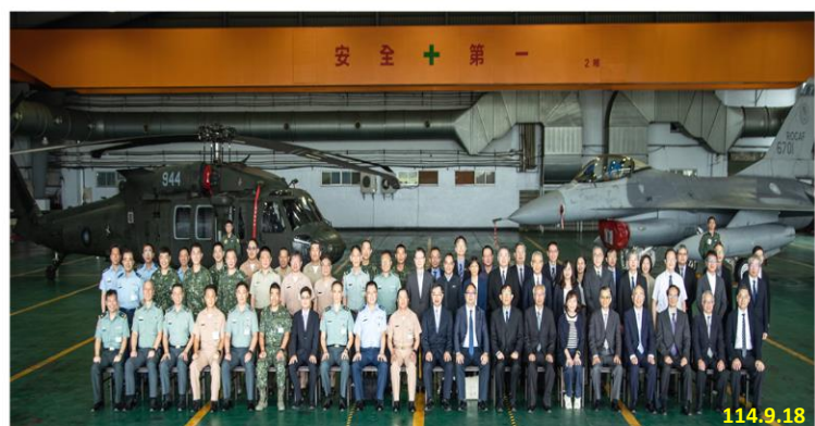
「114 年檢察機關與軍事機關業務聯繫會議」大合照