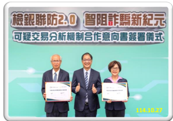
本署與第一銀行 【檢銀聯防 2.0 智阻詐騙新紀元】 可疑交易分析機制簽署儀式

本署分別與中小企銀、合作金庫、華南銀行、第一銀行簽署「可疑交易分析機制」合作意向書，運用金融科技，全面聯防阻詐機制，分析掌握潛藏之不法金融帳戶，得以期前對不法帳戶採取風險管控措施，避免成為詐欺及洗錢管道，並藉由相互間所提供之可疑交易異常因子、參數模型及疑似重大金融詐欺不法情資，並結合法務部調查局洗錢防制處通報，攔阻不法洗錢金流、溯源查緝詐欺集團，共同懲阻詐騙，守護民眾財產。