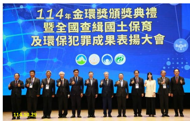
現場與會長官合照