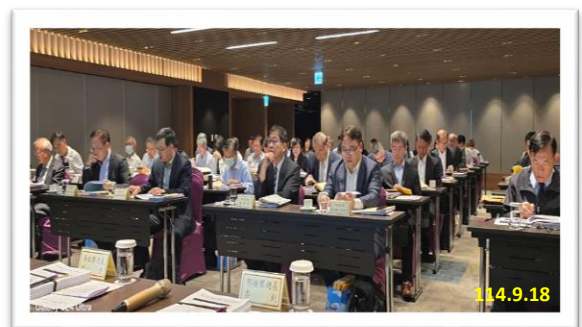
114 年度第 2 次檢察長業務座談會