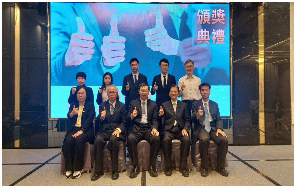
與會長官與得獎人員合影