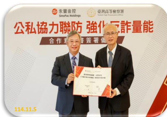
【公司協力聯防 強化反詐量能】

本署張斗輝檢察長表示，人頭帳戶為詐欺、洗錢之工具，要抑制詐騙案件，首要減少人頭帳戶，經本署統計，單純人頭帳戶新收案件，113 年全年與 112 年相較，下降了近 40%，今年 1 至 9 月，與去年同期相較，下降了近 20%；另警示帳戶發生數，今年 9 月已呈現負成長之情形，這是跨機關、公私協力合作的成效。但詐騙集團為獲取不法利得，其詐騙手法隨著科技、網路及時勢進化，本署會持續就相關詐欺議題，滾動式檢討，並與相關部會，進行研議解決之道，共同抑制詐欺犯罪。本署所推行之「可疑帳戶預警中心機制」，透過檢、警、金之合作，尤其在無被害人之第二層以上之洗錢帳戶或假投資詐騙之潛在被害人時，透過通報平台，由檢察機關提前攔阻被害人遭詐騙之財產，有助於協助金融機構精準阻詐及溯源偵辦重大詐欺案件。