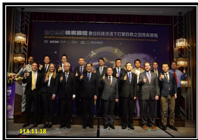
「2025 檢察論壇—數位科技洪流下打擊詐欺之因應與策略」研討會

行政院林明昕政務委員致詞表示，隨著科技進步，詐欺犯罪已演變為高度組織化、數位化及跨境運作的智慧犯罪模式，利用數位支付、加密貨幣、