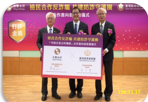
【檢民合作反詐騙 共建防詐守護圈】