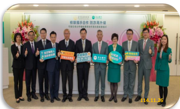
邀請徐政務次長致詞勉勵，金管會銀行局王允中副局長、臺北地檢署王俊力檢察長、新北地檢署郭永發檢察長、士林地檢署張云綺檢察長等首長到場觀禮。

法務部徐錫祥政務次長表示：現代的詐欺是資訊戰，隨著 AI 科技發展而迅速演變，詐欺手法日益多元化，是所有金融及執法體系所需正視的嚴峻課題。法務部為懲詐主責機關，懲詐 2.0 以溯源查緝境內、外電信詐欺、被害保護及防詐宣導為重點。經臺高檢署統計人頭帳戶案件，今年 1 至 10 月，與去年同期相較，下降 19.6%，且佔所有電信詐騙案件，約 57%，與 112 年最高峰之佔比達 83%，有顯著的下降，這是法務部、金管會、金融機構共同努力的成效。為免民眾遭詐騙受損，法務部已促請全國各地方檢察署就防詐及查獲重大詐欺案件，以「短影音」之公告方式，為防詐、懲詐之宣導。全民普發現金新臺幣 1 萬元，已開始登記發放，法務部為宣導民眾防詐，已在官網上，以短影音之方式宣導「普發現金四不原則」，提醒民眾勿受騙。