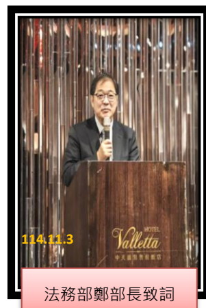
法務部鄭部長致詞

法務部鄭銘謙部長致詞： 現今電信詐騙集團透過科技、網路虛擬等方式詐騙民眾，是危害全世界最大的跨境犯罪。政府在打擊詐欺之努力及成果，應讓外界了解，法務部已促請所屬機關，以「短影音」之宣導方式，讓民眾知悉法務部防詐及懲詐之成效，並提醒民眾了解最新詐騙手法，慎防遭詐騙。而臺高檢署所推行之「可疑帳戶預警中心機制」，由各