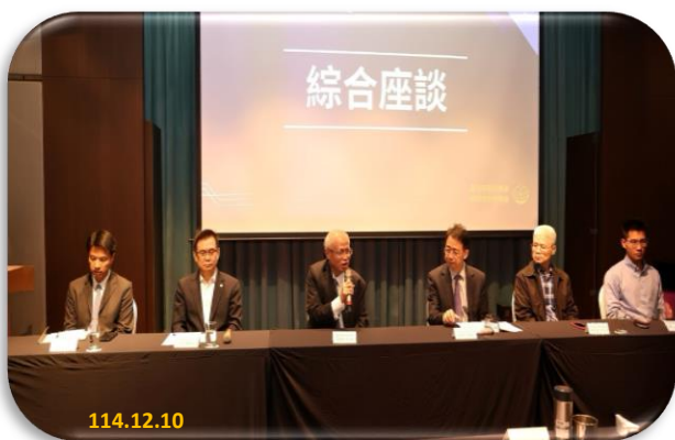
本署張檢察長主持綜合會談

31%，下降至今年 10 月佔 24%。在跨部會合作努力下，詐欺案件數減少下降，查緝成效並未因此打折，值得肯定。但是詐欺集團詐騙手法日新月異，依本署統計車手案件數，113 年與 112 年全年相較，成長了 103%，今年 1 至 10 月，與去年同期相較，成長了 70%，非本國籍之車手，成長了 330%；另外，詐團為取得帳戶作為詐騙及洗錢工具，已從取得自然人帳戶，轉向取得公司法人帳戶，本署自今年 10 月 16 日起，已多次邀集相關機關，研議具體防制措施及策進作為，以防止詐欺、洗錢。因應詐欺集團手法之轉變，仍需跨部會提出相關策進作為，共同打擊詐欺犯罪，守護民眾財產。