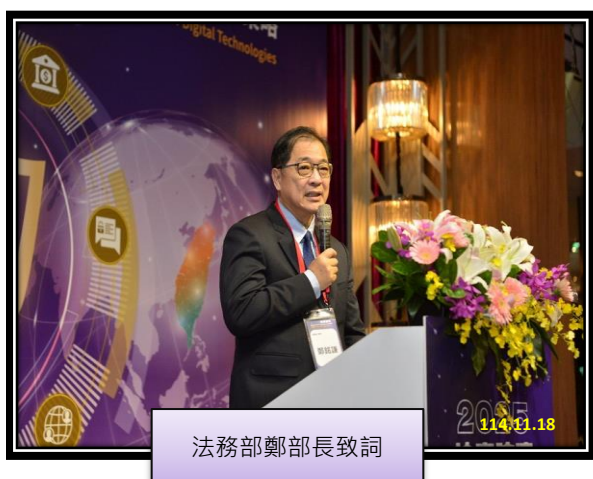
法務部鄭部長致詞

法務部鄭銘謙部長致詞表示，「五打七安」為政府施政重點，「打擊詐欺」為重中之重，而懲詐 2.0「運用 AI 查緝、深化國際合作、強化跨機關合作、公私協力」打擊詐欺，及「落實罪贓返還，查扣、變價、沒收犯罪不法所得」，以填補被害人所受損害，為法務部現階段打詐核心工作，法務部將透過國際交流平台，持續推動與國際友人經驗分享、資訊共享等國際合作與交流，以共同有效打擊詐欺犯罪。