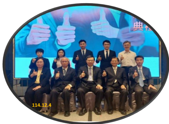
與會長官與有功人員合照