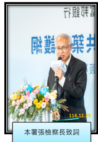
本署張檢察長致詞

本署張斗輝檢察長表示：打詐綱領 2.0 以「減少詐欺發生數及降低財損數」為目標，而「跨機關合作及公私協力」為達成此目標的重點之一。雖然各項數據顯示，詐欺案件之發生數、警示帳戶數、平均財損數，均呈下降趨勢，但詐騙、洗錢集團為詐取不法利益，除轉變其詐欺手法外，並改以車手提款或面交提款，以避免金融機構攔阻，且為加速詐欺、洗錢之成效，已想方設法取得人頭公司戶。如何防止車手提領贓款及詐騙集團跨境洗錢，臺高檢署已持續邀請相關部會，共同研議防止詐欺、洗錢犯罪之措施及策進作為。期盼透過前端源頭管理，結合後端溯源查緝，共同打擊詐欺，讓民眾有感政府打詐之決心。