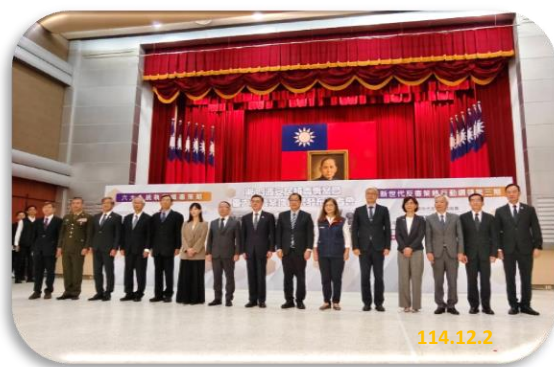
第十三波「安居緝毒專案」與會長官合照

本署與六大緝毒系統將持續密切合作，精準盤點毒品趨勢，強化跨部會整合，從源頭阻斷毒品流入，向下刨根、全面掃蕩，建構最緊密的緝毒網絡，守護國人健康，落實行政院新世代反毒策略之目標。