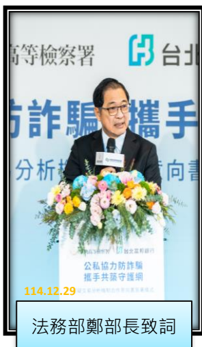
法務部鄭部長致詞

法務部鄭銘謙部長表示：打詐綱領 2.0 施行迄今已近一年，法務部為懲詐主責機關，指示檢察機關嚴厲查緝詐欺集團，並透過偵、審中之和調解機制，促請被告賠償被害人所受損害。經臺高檢署統計，今年 1 至 11 月，懲詐團隊查緝詐欺集團數之指標達成率，已達預設績效指標 124%，而電信詐騙及單純人頭帳戶新收案件數，則呈現下降之趨勢，這是所有跨機關及公私合作共同努力的成果，值得肯定。另外，法務部已提修法對高額（100 萬元）詐欺犯罪，提高法定刑責；強化填補被害人損害，需自首、自白且於 6 個月內賠償全額之被告，始能獲得法院裁量減免刑責；增訂禁奢條款，作為量刑參考標準，相信經立法院三讀通過後，可以強化打擊詐欺犯罪之力道，讓人民有感。