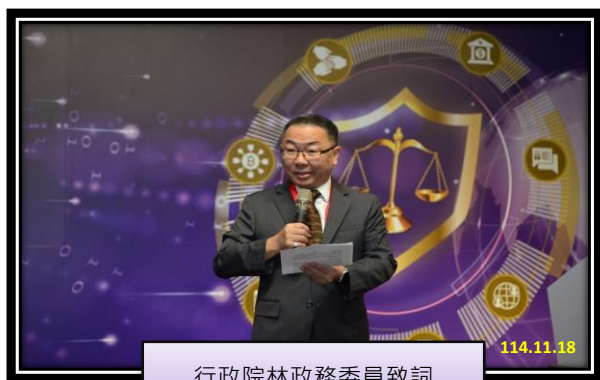
行政院林政務委員致詞

深偽技術與人工智慧等數位科技，使得手段日益複雜。他強調，本論壇聚焦於虛擬資產、國際合作、跨機關協作與人工智慧等打詐關鍵議題，確實呼應「新世代打擊詐欺策略行動綱領 2.0」的五大核心策略—結合跨部會協力與公私合作等機制，強力辦理識詐、堵詐、防詐、阻詐、懲詐等工作，並充分展現我國面對數位時代新型犯罪的決心與前瞻思維。希望透過本次國際論壇，不分彼此能夠攜手，共同分享在虛擬資產、國際合作與跨機關、公私協力及人工智慧應用等面向的寶貴經驗，以提升台灣打詐策略及效能，也期望透過跨境合作攜手升級為「打詐國際隊」。