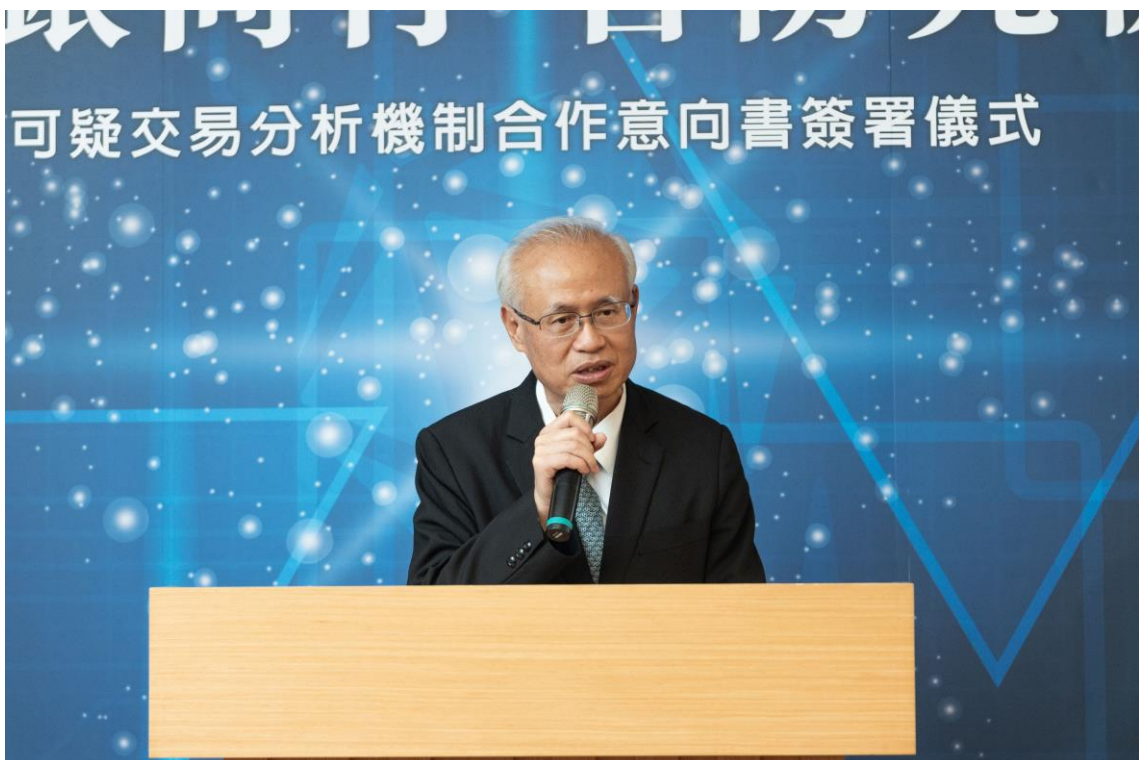
臺高檢署張斗輝檢察長致辭