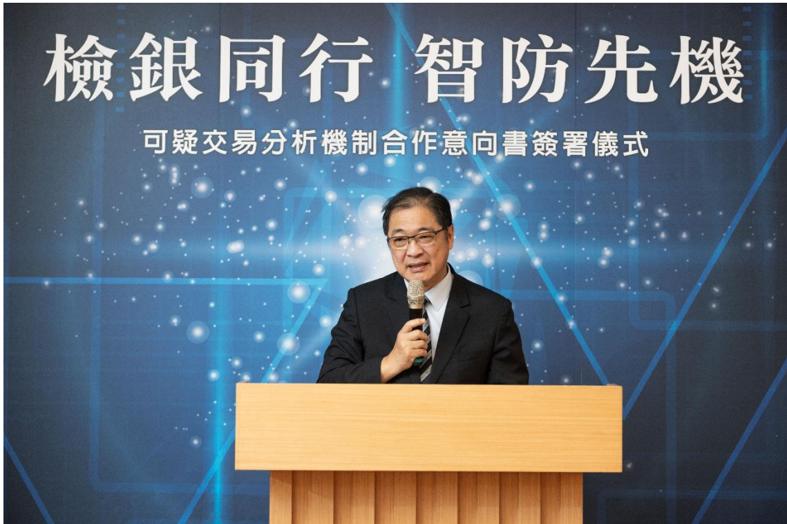
法務部鄭銘謙部長致辭勉勵