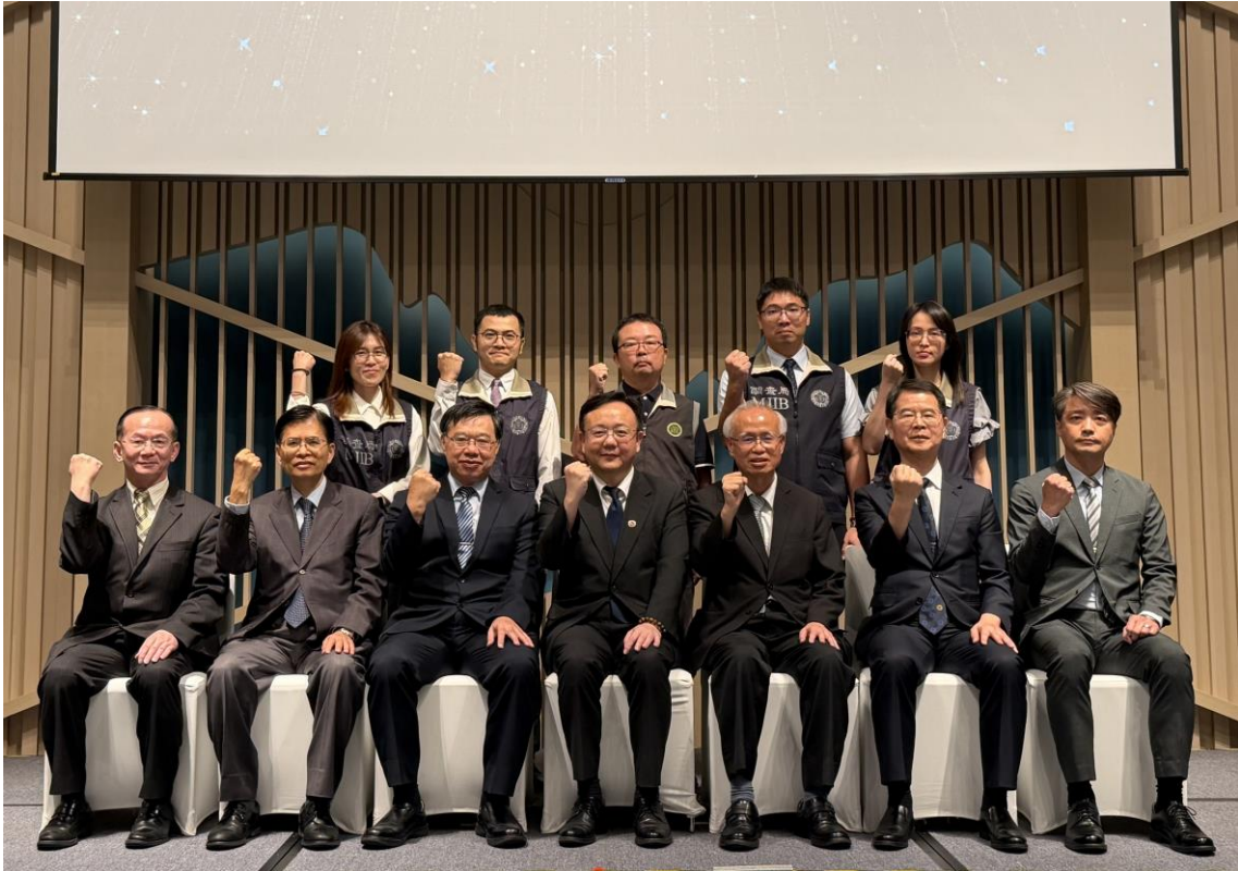
與會長官與調查機關打擊詐欺有功人員合影