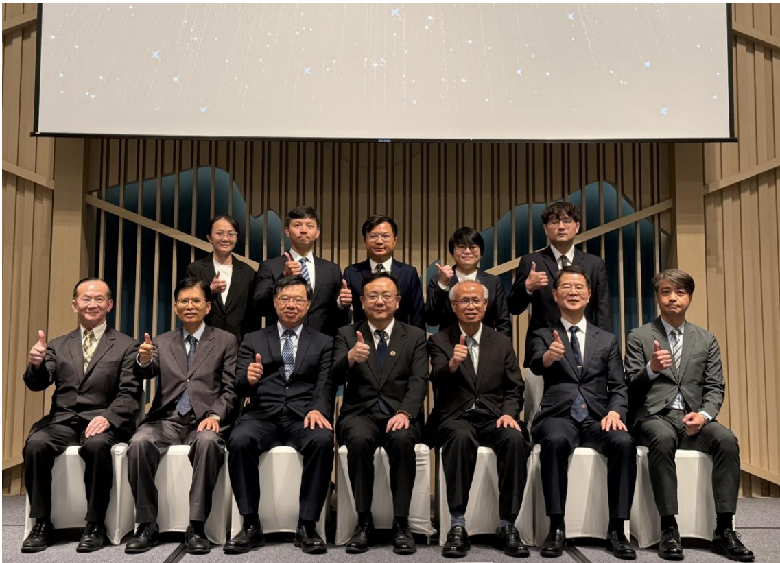
與會長官與警察機關打擊詐欺有功人員合影