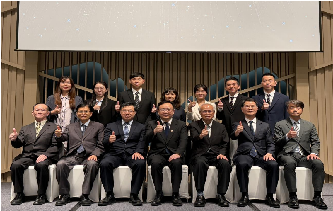
與會長官與檢察機關打擊詐欺有功人員合影