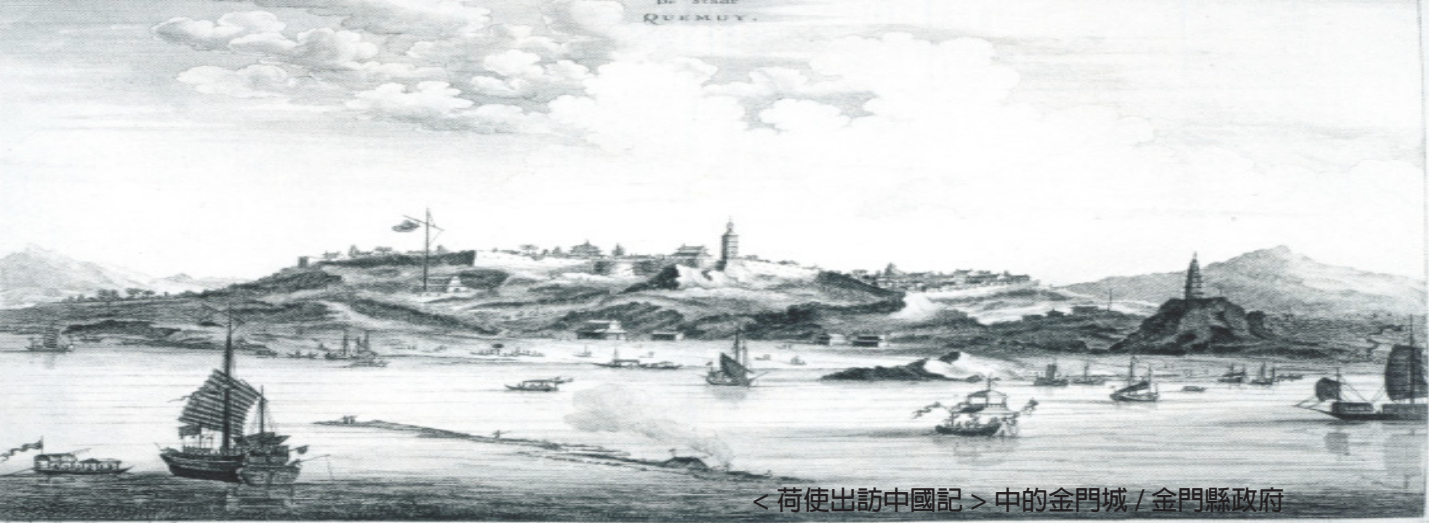
<荷使出訪中國記> 中的金門城 / 金門縣政府

與此相對，由警察或檢察官作成之訊問紀錄，縱令內容係被告自白，原則上亦不得於日後公判時引為證據，蓋因訊問被告屬預審法官之專權，非警察或檢察官所有，因而警察或檢察官作成之紀錄，實務上稱為「聽取書」，而與前述預審法官作成之「訊問調書」應嚴加區別，復因「聽取書」非法律所承認，屬非正式之調查紀錄，故規定不得與「訊問調書」之格式相同以一問一答方式記載，從而，實務上便以獨白式的樣貌呈現，二次戰後制頒新刑事訴訟法廢除預審制度，但上開檢、警訊問被告後為獨白式記錄之慣行仍繼續沿用至今，而為其筆錄之特有文體。