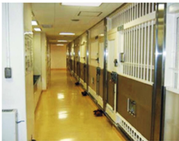
警察留置場の内部

起訴前經法院裁定羈押者，該被告之拘禁留置場所本應在法務省管轄下之「拘置所」（類似我國之看守所），但日本實務偵查中羈押之被告卻多留置在警察機關之留置所（日文稱「警察留置場」，參下相片）。