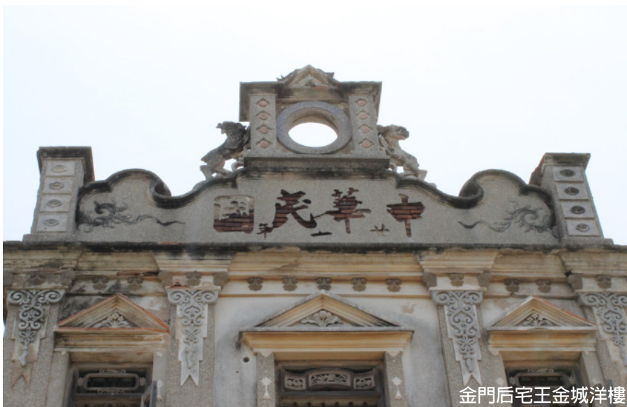
金門后宅王金城洋樓