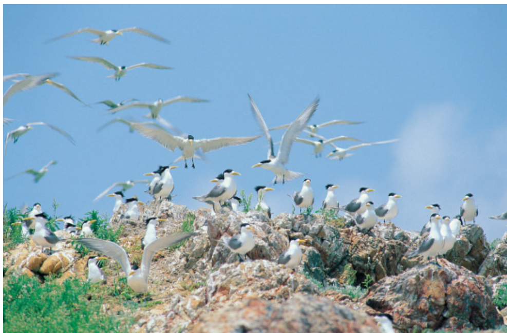
鳳頭燕鷗