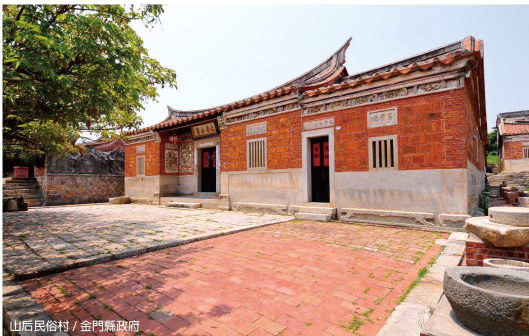
山后民俗村 / 金門縣政府