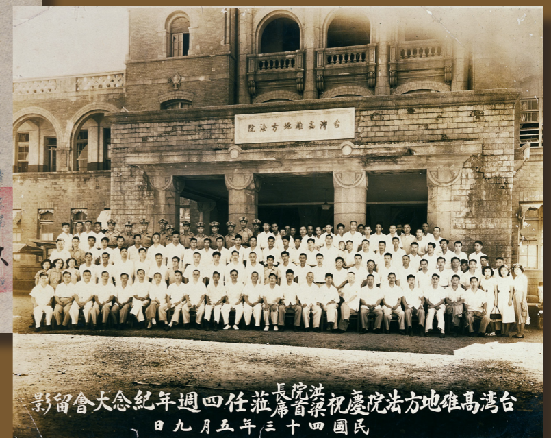
影留會大念紀年週四任蒞第首察祝慶院法方地確高灣台 日九月五年三十四國民