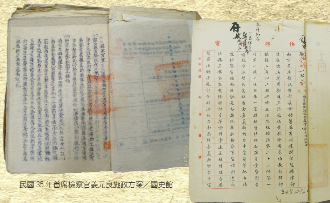
民國35年首席檢察官姜元良施政方案