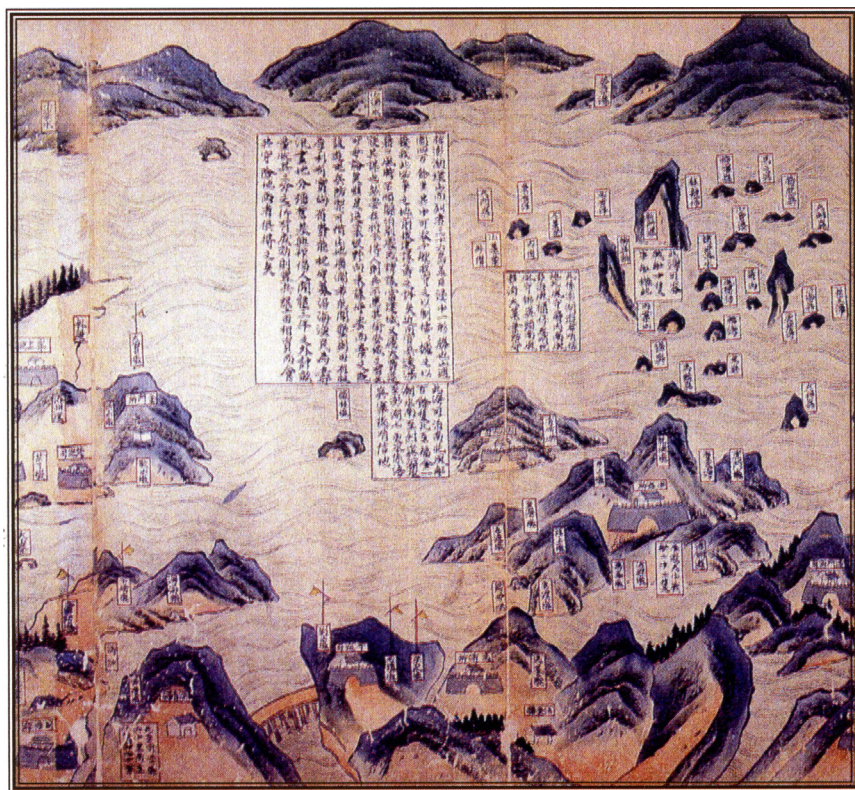
〈福建海防圖〉局部 / 金門縣政府