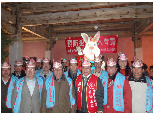
100年配合地檢署辦理元宵法律宣導