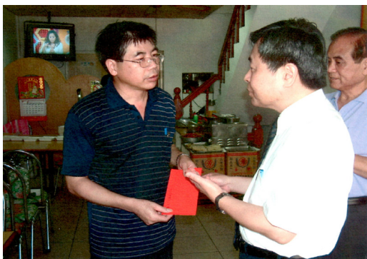
主任委員偕同榮譽主任委員訪視被害人家屬