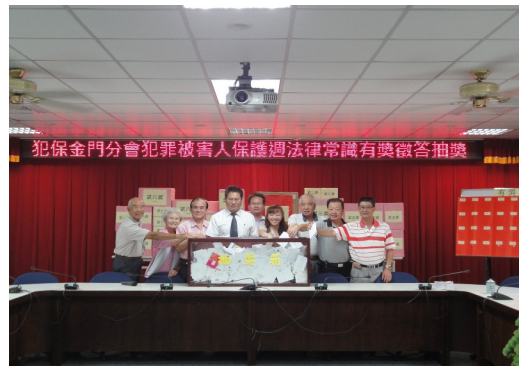
辦理100年犯保週有獎徵答抽獎活動