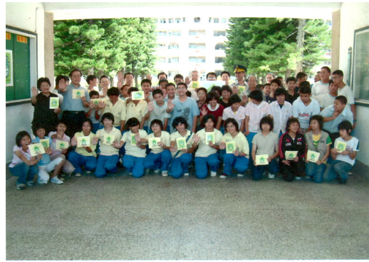
配合金門地檢署辦理反毒暨法治教育營活動