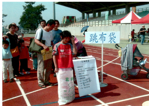
辦理 96 年反毒反貪反賄選親子體適能嘉年華會