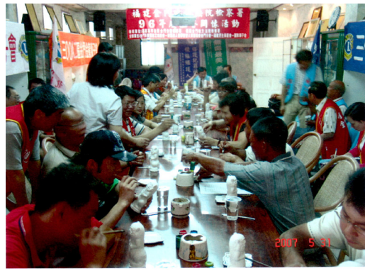
辦理 96 年溫馨關懷活動－與受保護人彩繪風獅爺