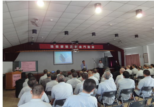
入監辦理犯罪被害人保護法宣導