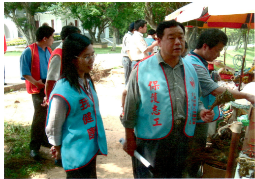
配合金門地檢署辦理黑心食品宣導活動