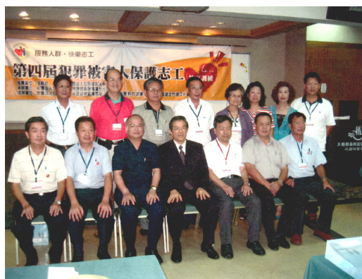
第四屆犯罪保護志工教育訓練於三峽鎮大板根森林度假村舉行