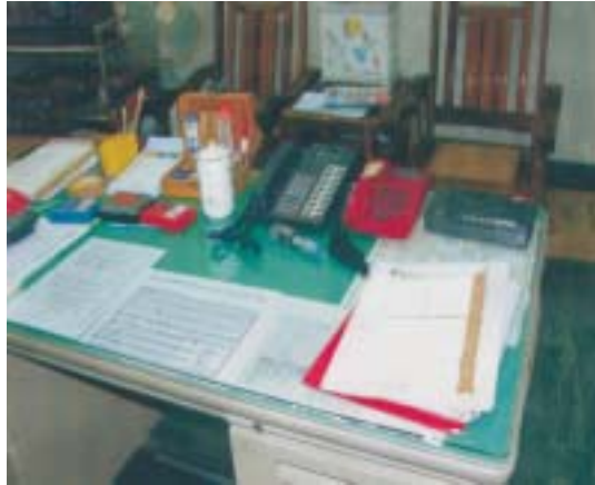
本署書記官長辦公室

書記官長辦公位置壅塞陳舊狀況，且時有洽公來賓、記者及其他單位同仁，為使有商談空間，提高辦公效率，改善辦公空間。