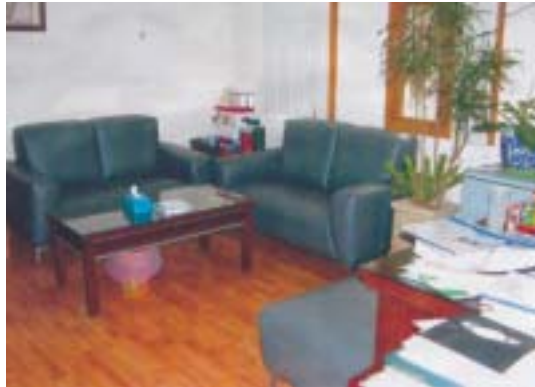
院方書記官長辦公室