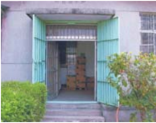
原少觀所辦公室正門