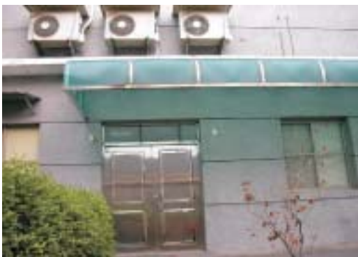
分案室（原少觀所辦公室正門）