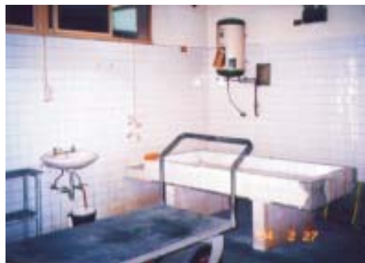
本署相驗解剖中心（惠來殯葬所解剖室）