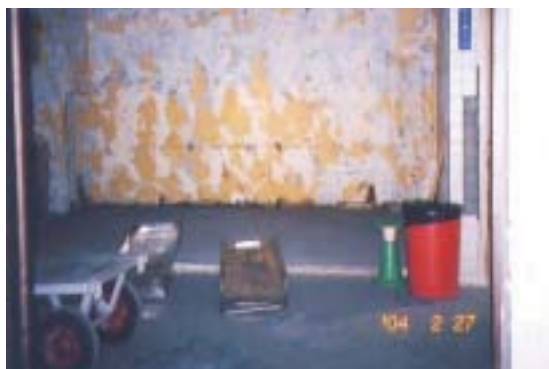
本署相驗解剖中心（惠來殯葬所解剖室）

本署本著敬重往生者，在相驗解剖時基本尊嚴及對死者之敬重，確有立即著手規劃一處較現代化之相驗解剖處所，特商請雲林縣政府及本縣虎尾鎮周鎮長，