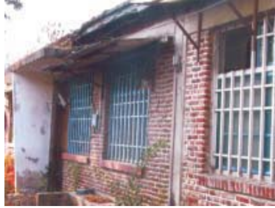
本署明正路 44 巷職務宿舍

本署座落虎尾鎮明正路 44 巷 1 至 19 號職務宿舍共計 19 間，原為臺灣雲林看守所管理，於 89 年間移撥本署管理；該宿舍均建於民國 53 年前，至今已逾 40 年，且為木磚造平房，長期以來因無經費整修，木柱、屋樑蟲蛀嚴重，部分屋頂已塌陷；規畫予以整修，以維公產之完整，並解本署職務宿舍不足之困擾。