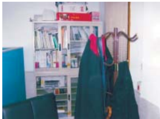
本署檢察官辦公室空間