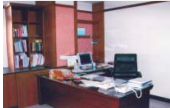
院方法官辦公空間

人或三人或四人合署辦公，為避免檢察官辦案思慮遭受干擾，於94年度規劃每一位檢察官一間辦公室。