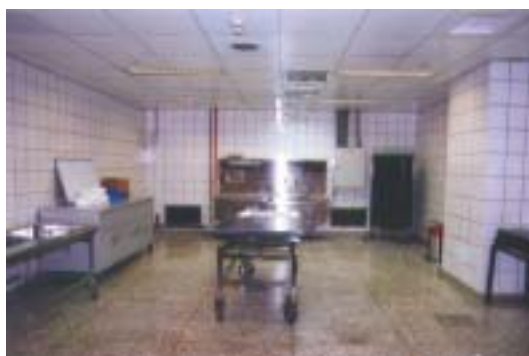
大林慈濟醫院現代化解剖室（願景）

規劃於本縣虎尾鎮公所管理之惠來殯葬所整修現代化之法醫解剖中心一處，區隔為相驗解剖室、檢察官臨時偵查庭、相驗時家屬休息室等三區。