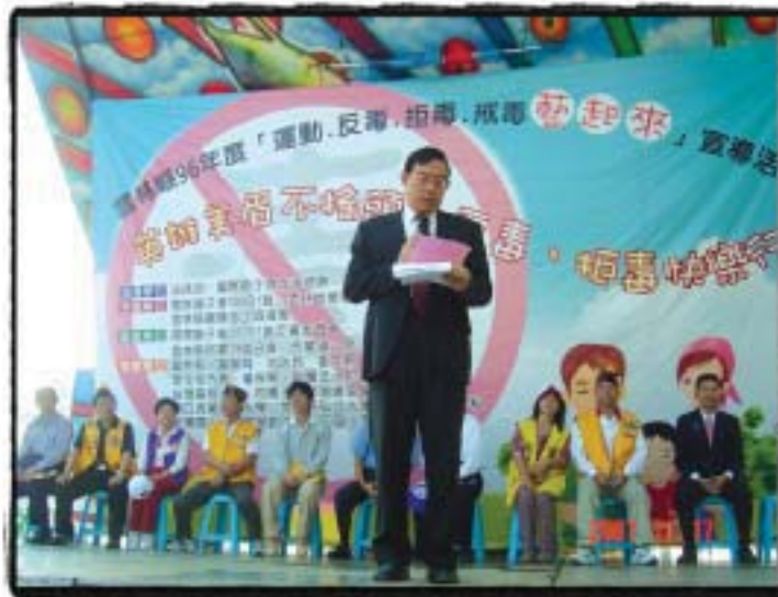
96年11月 反毒大型嘉年華 刑檢察長上台勉勵