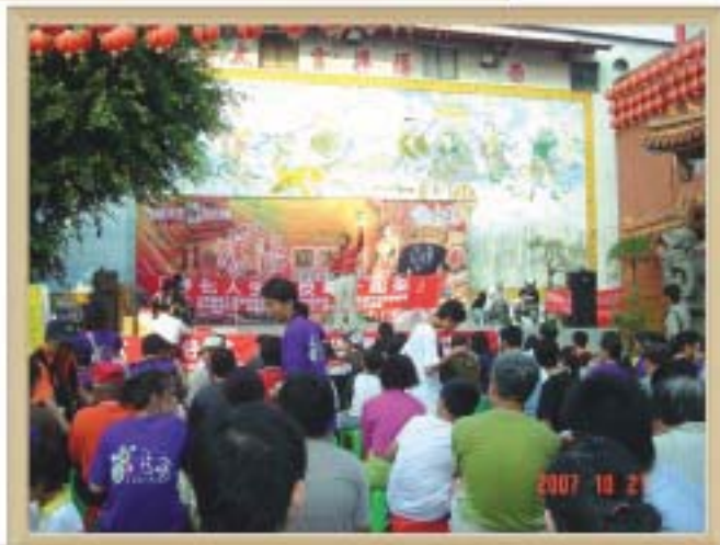
96年10月 反毒大型路跑活動