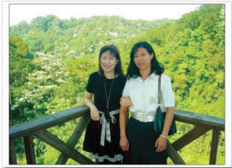
左：觀護協進會祕書；右：司法志工