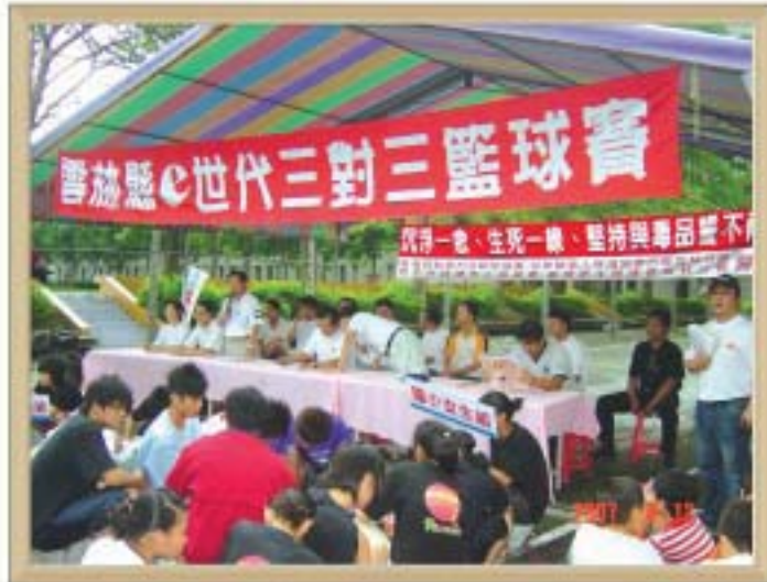
96年8月 3對3籃球 宣導活動