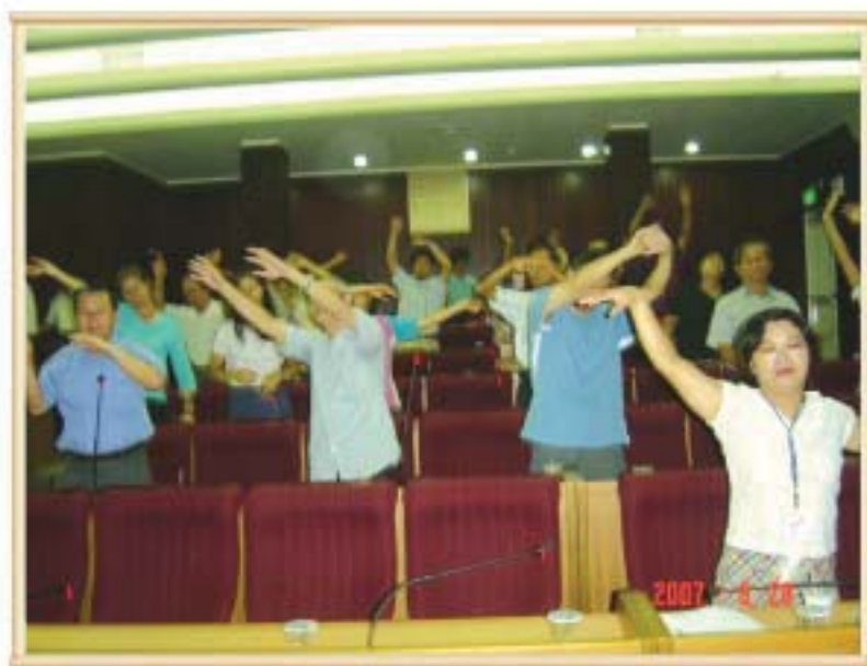
96年8月活潑生動之研習課程