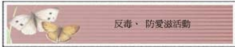
96年2月 毒品替代療法會議