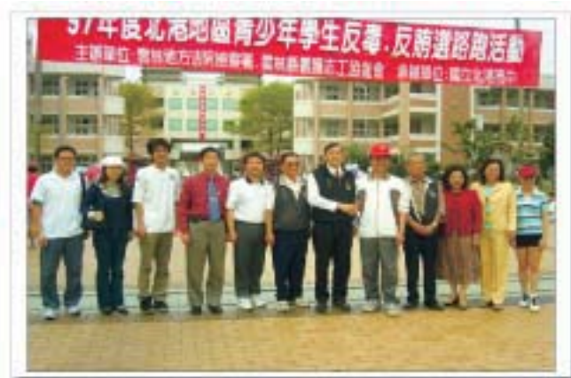
北港地區青少年反毒及反賄選路跑活動