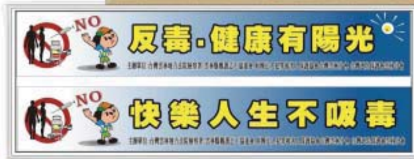
96年度 製作反毒大海報及布條