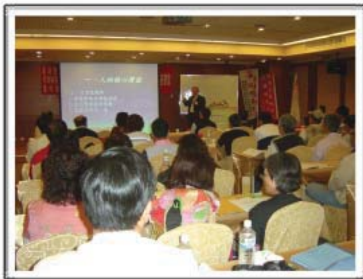
97年5月 國寶級專業師資 課程